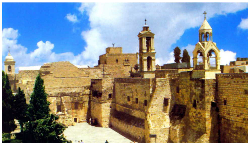
Belém - Igreja Natividade